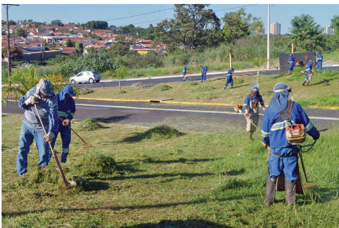
'Prefeitura nos Bairros'

EVENTO É NA EMEF LUIZ ROBERTO SALINAS FORTES, ÀS 9H; PROGRAMA FICA NOS BAIRROS DA REGIÃO ATÉ O DIA 27 COM ATENDIMENTOS SOCIAIS E EQUIPES DE OBRAS E MOBILIDADE URBANA